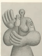
Hans Ticha, Beifall, 1982, Bleistift, VG Bild-Kunst, Bonn 2018