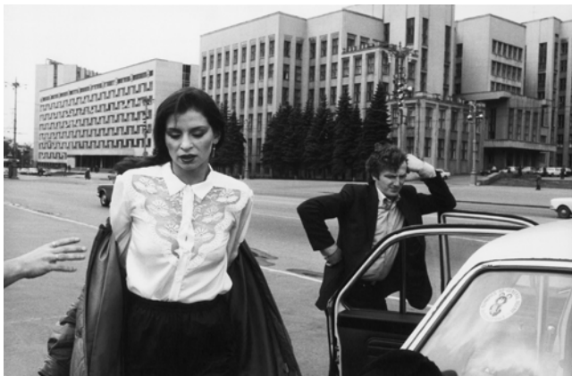
Ute Mahler, Elke, Minsk, 1981, Silbergelatineabzug © Ute Mahler

In Kooperation mit dem Kunsthalle Rostock