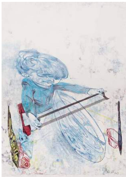
Bodo Rott: Monotypie auf Papier, aus der Serie Bubblestereo, 2017

Im Packhof antworten den zweidimensionalen Welten die dreidimensionalen, rätselhaften Objekte und anthropomorphe Gebilde aus der Sammlung des des Brandenburgischen Landesmuseums für moderne Kunst.