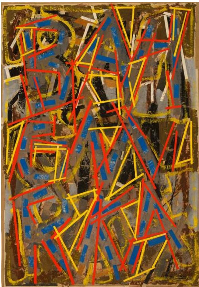
Günther Hornig, Fortlaufendes Alphabet, 1984, VG Bild-Kunst, Bonn 2018